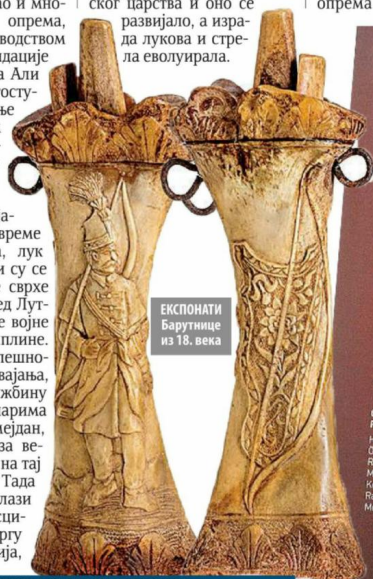
ЕКСПОНАТИ Барутнице из 18. века

чарство пренели из Азије, а јачањем и ширењем османског царства и оно се развијало, а израда лукова и стрела еволуирала.